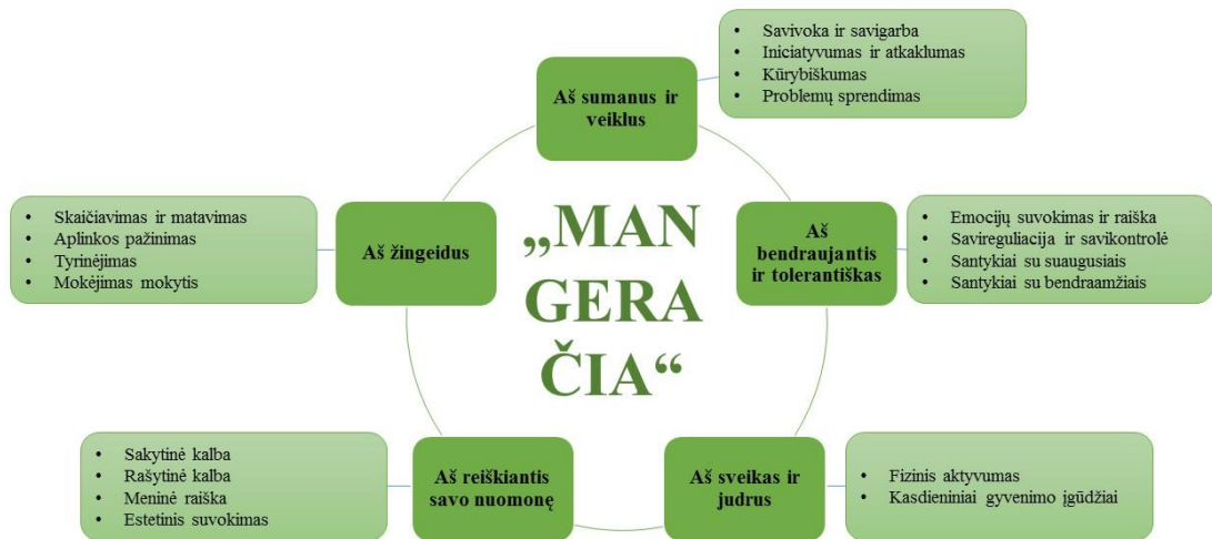
1 pav. Vaiko ugdymo pasiekimų sričių jungimas į ugdymo kryptis.

Grupių tėvų susirinkimų metu, tėvai išsakydami savo lūkesčius pedagogams, ugdymo įstaigai ir ugdymo procesui nurodė, kad jiems svarbu jog, vaikas augtų sumanus, veiklus, žingeidus, bendraujantis, tolerantiškas, reiškiantis savo nuomonę bei sveikas ir judrus. Siekiant sudaryti sąlygas vaikui ugdytis asmenines savybes ir gebėjimus - 18 ugdymosi pasiekimų sričių Programoje jungiamos į 5 ugdymo kryptis (1 pav.) padedančias lavinti šias vaiko asmenines savybes (1 paveikslėlis).